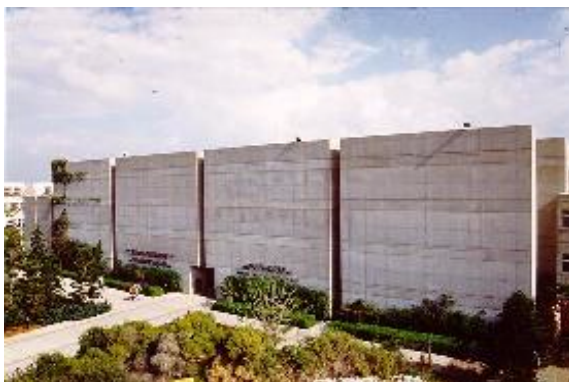
בנין וולפסון להנדסה מכנית

אדריכלית מוזרה זו תוכננה לבקשת התורם ע"י האדריכל הנודע לואי קאהן, ברוח עבודתו הקודמת שזכתה לתהילה, ובצדק (היא ממוקמת באזור מוכה סופות שלגים בערבות קנדה).