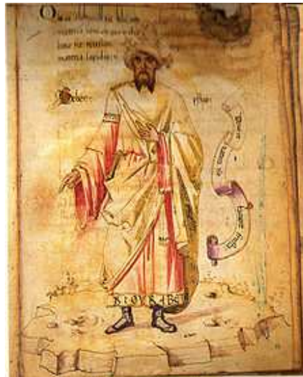
Портрет Гибера, Европа 15-й век, Библиотека Лоренцо Медичи, Флоренция