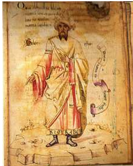
Портрет Гибера, Европа 15-й век, Библиотека Лоренцо Медичи, Флоренция