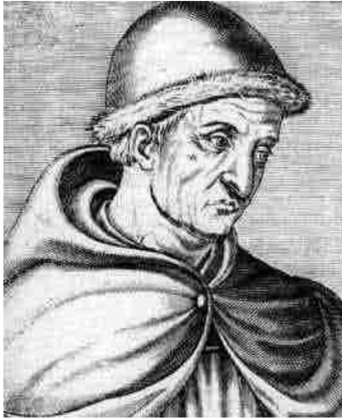
Роджер Бэкон (1214 - 1292)